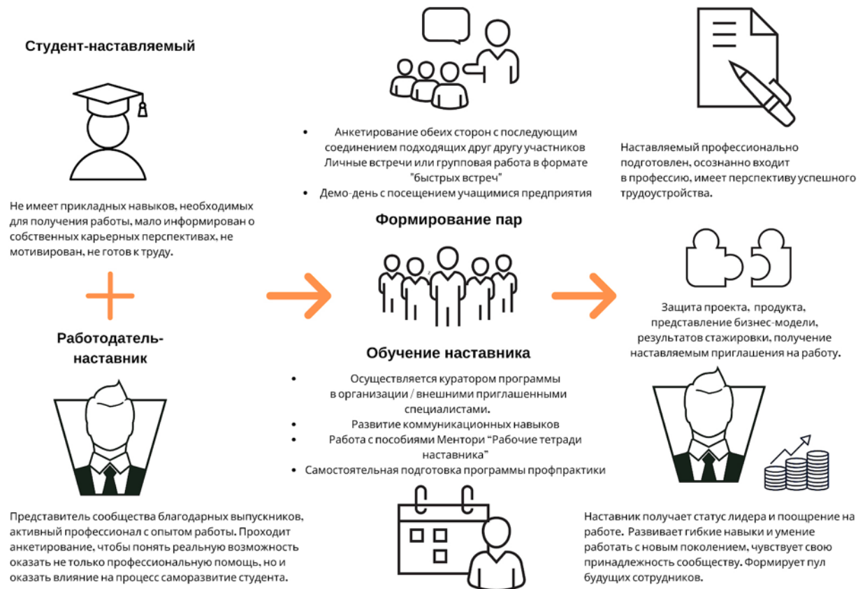
Рисунок 5. Графическое представление реализации программы наставничества по форме «работодатель – студент».