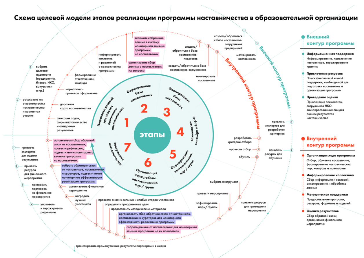
Рис. 6. Схема целевой модели этапов реализации программы в образовательной организации

Содержание каждого этапа, представленное в виде направлений работы с внутренним и внешним контурами, содержится в таблице 1 «Целевая модель этапов реализации программы наставничества в образовательной организации». В таблице 2 «Целевая модель программы наставничества в образовательной организации» представлены основные компоненты программы наставничества.