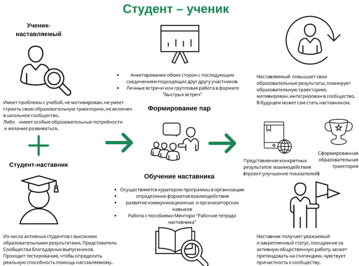
Рисунок 3. Графическое представление реализации программы наставничества по форме «студент – ученик».