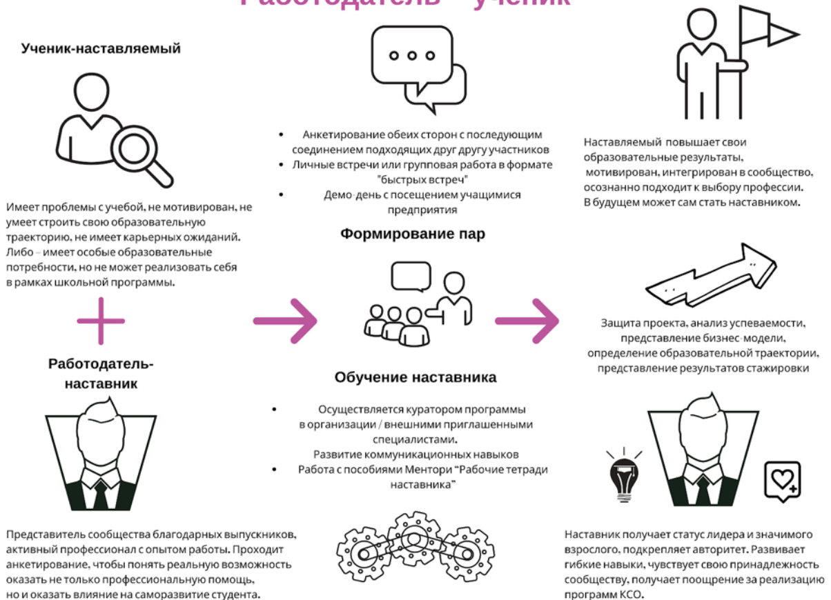
Рисунок 4. Графическое представление реализации программы наставничества по форме «работодатель – ученик».